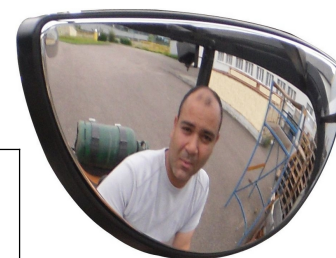
Opis: lusterko 4