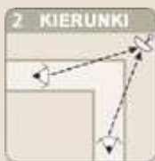
Kontrola 2 kierunków

Lustra dostarczane są z kompletem uniwersalnych uchwytów pozwalających na dokładne przymocowanie do ściany lub słupa o średnicy 34–90 mm.