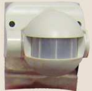
Czujnik ruchu (dostarczany wraz z lustrem).